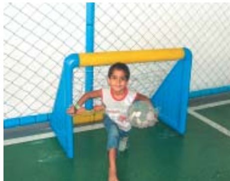
A garotada entre as muitas atrações: adoraram o elevador kabum, a miniquadra de futebol de salão e a mesa de totô

Fez muito sucesso também o monotrilha - um trenzinho que fica no alto da casa de festas, e que sai do espaço interno, levando a garotada ao delírio