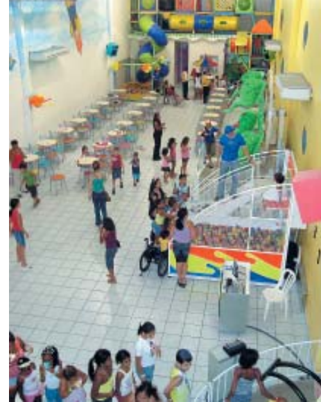
Salão principal da Casa de Festas Estação Faz de Conta