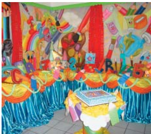
O bolo e a mesa principal da festa

A Lourdes precisa muito do apoio de todos os colaboradores. Vamos nos empenhar e dar as boas-vindas ao pessoal do Grupo Samfer.