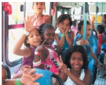
Pela alegria que demonstravam, as crianças adoraram esta comemoração só para elas