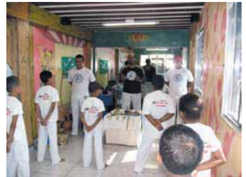
Aulas de Capoeira com apresentação, exame de cordel e batizado

Principalmente, levando-se em conta que foi a primeira vez que as turmas de dança do Ponto de Partida participaram de um evento com essa magnitude.