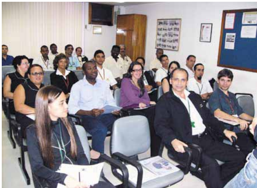
Treinamento “Como lidar com clientes difíceis”

Novos e antigos colaboradores têm o entendimento que uma das principais preocupações da empresa nos últimos anos tem sido a de implementar ações que visem um atendimento de qualidade ao usuário e uma evolução permanente de seus funcionários, por meio de cursos ou treinamentos.